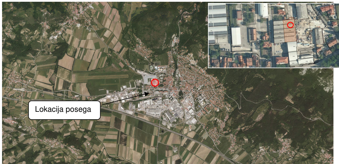
Slika 1: Lokacija industrijskega objekta za odstranitev ( https://gis.iobcina.si/gisapp/Default.aspx?a=ajdovscina )

Lokacija posega se nahaja v Ajdovščini, na parcelni št. 297/65, k.o. Ajdovščina (slika 1). Investitor želi odstraniti obstoječi industrijski objekt v kompleksu Lipa (stavbo št. 2075).